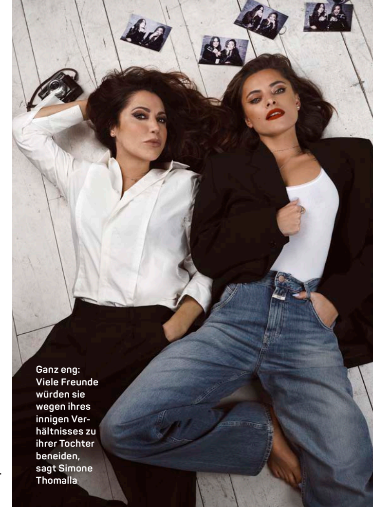
Ganz eng: Viele Freunde würden sie wegen ihres innigen Verhältnisses zu ihrer Tochter beneiden, sagt Simone Thomalla