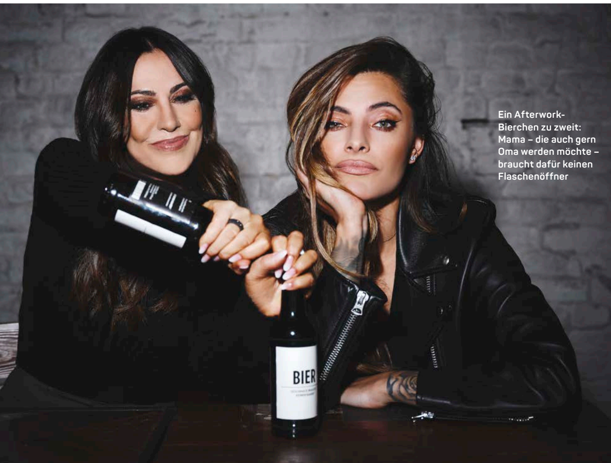
Ein Afterwork-Bierchen zu zweit: Mama – die auch gern Oma werden möchte – braucht dafür keinen Flaschenöffner

Auch Wäschewaschen ist für mich allein komplett ätzend. Für einen Partner mache ich das aber alles gerne, dann arbeite ich die Dinge einfach ab.